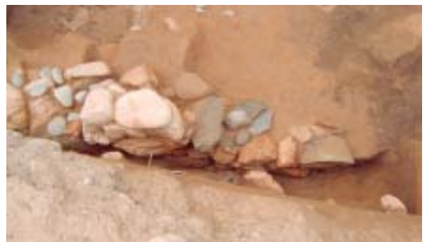
4区 石積み遺構 北から