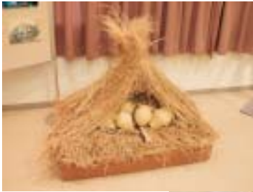
土器野焼きモデルの展示

各コーナーでは、体験工房で実施している弥生時代の体験に関連する道具などもあわせて展示し、発掘成果をもとに体験メニューが行われていることを理解していただけるように心がけました。