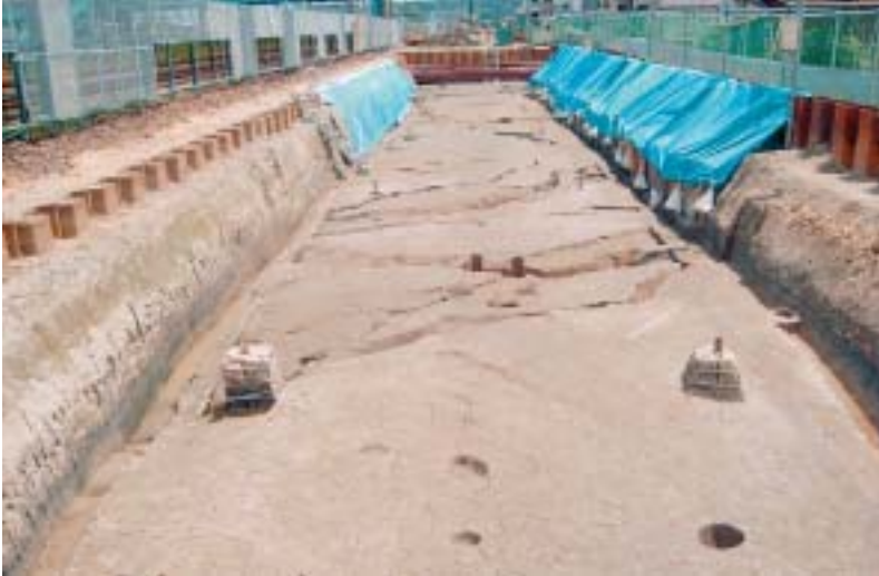
発見された弥生時代の溝