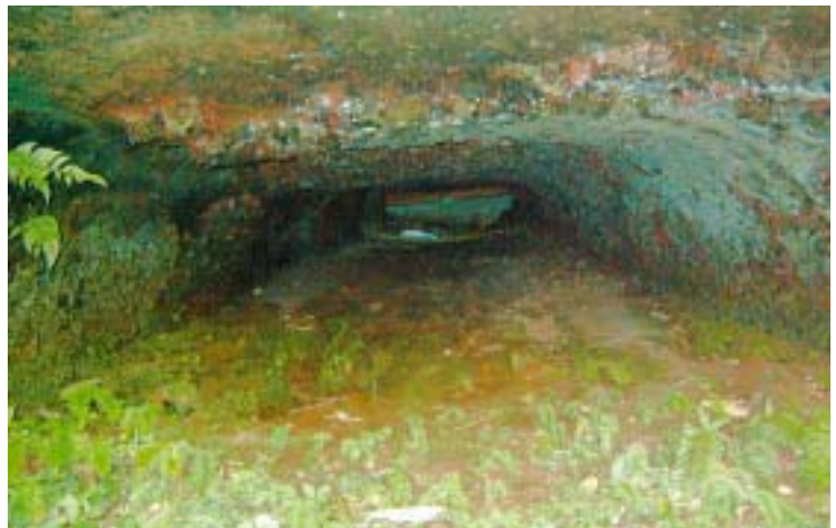
西方寺1号窯跡内部