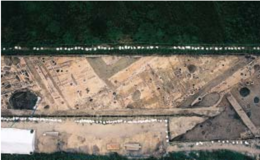
調査区航空写真 区画溝や井戸が見えます。