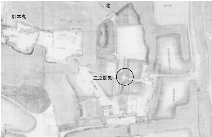
城内文間絵図『小松市史資料編 1 小松城』より転載

今回の調査では、従来遺構確認面として認識されていなかった上層面が確認できました。時期的には寛永年間の前田利常による大規模改修以後と判断される遺構面であり、小松城の全貌を明らかにする上で重要な成果が得られたといえるでしょう。