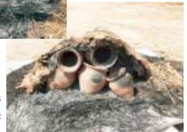
展示期間の後半は、この状態で展示しました。