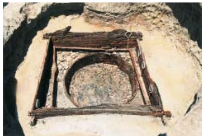
木組みの井戸です。底には砂利が入られていました。 水をきれいにする工夫かな

小島西遺跡は、能登半島の七尾湾岸、七尾市小島町地内に位置します。今年度の調査では、古墳時代から近世にかけての遺構、遺物が確認されています。