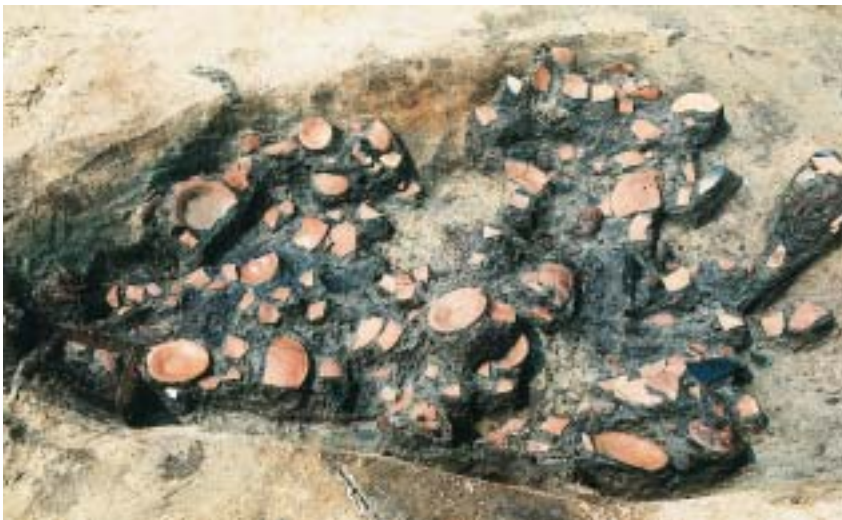
土師器皿出土状況（16世紀） たくさんの皿が炭化物といっしょに出土しました。