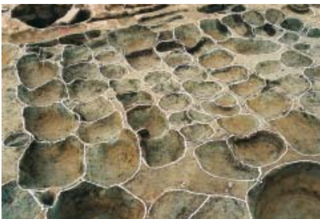
四角い穴が並んでみつけられました。 甕を埋めた穴かな