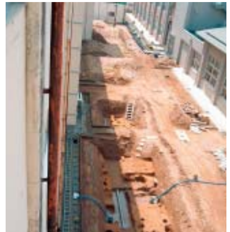
東半部調査区(2・3区)全景 東から 小松高校旧校舎より撮影