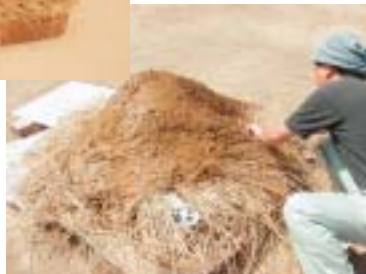
ワラの上に泥を塗る

各コーナーでは、体験工房で実施している弥生時代の体験に関連する道具などもあわせて展示し、発掘成果をもとに体験メニューが行われていることを理解していただけるように心がけました。