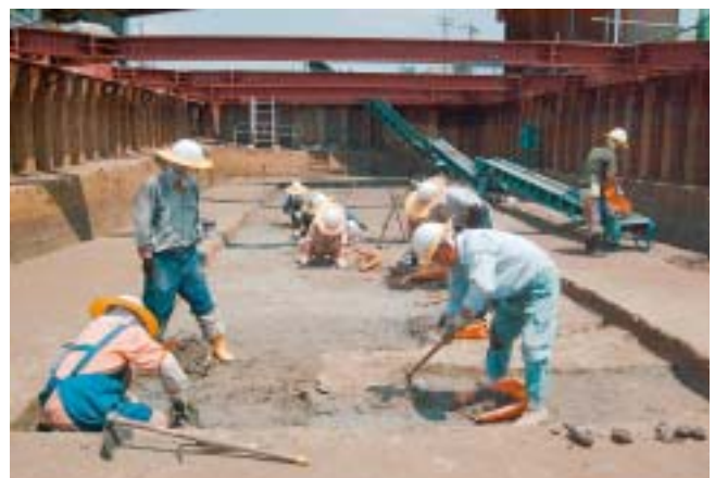
最も深い地点では鉄骨で壁を支える

おとまる 乙丸遺跡は金沢市乙丸町、浅野本町地内に存在します。地形としては浅野川と金腐川に挟まれた平野部にあたり、地表面の標高は約6mです。かつては水田が広がっていた場所でしたが、現在は道路と線路が交差し、建物が密集するなど市街地化が進んでおり、その面影はほとんどありません。