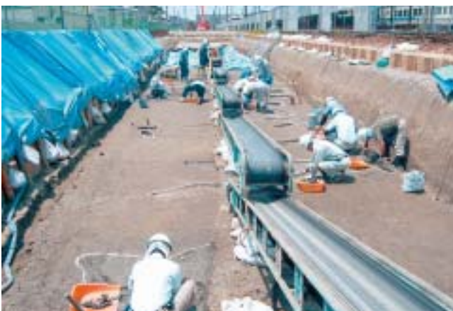
最も浅い地点でもこの深さ