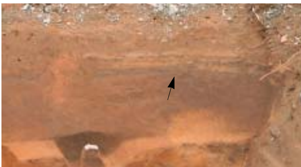
2区 南壁面 硬化した整地面を確認