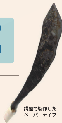
講座で製作した ペーパーナイフ